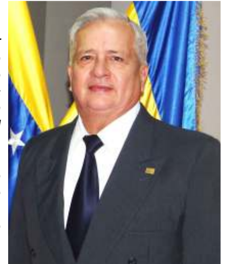
Dr. Pablo Reinaldo García U. Contralor del Estado Táchira

Los integrantes del Sistema Nacional de Control Fiscal tenemos la enorme responsabilidad de luchar contra la corrupción, tarea dura, exigente, difícil y compleja, donde hay una escasa formación de valores.