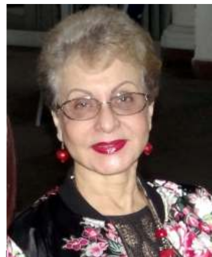
Dra. Omaira De León Contralora del Estado Táchira

Dentro de las actividades que realizó este Órgano de Control Fiscal a través de la Oficina de Atención al Público y Participación Ciudadana se encuentra el Trigésimo Cuarto Encuentro de la Contraloría con las Comunidades, el cual tiene como objetivo capacitar a los ciudadanos y ciudadanas en materia de Contraloría Social y denuncia, cumpliendo así con el 4° objetivo del Plan Estratégico del Sistema Nacional de Control Fiscal (PESNCF) 2016-2021, el Fortalecimiento del Poder Popular para salvaguardar el patrimonio público a través de la participación activa y protagónica del pueblo organizado.