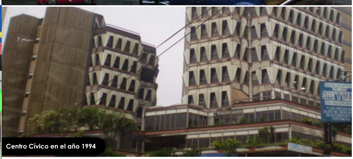
Centro Cívico en el año 1994