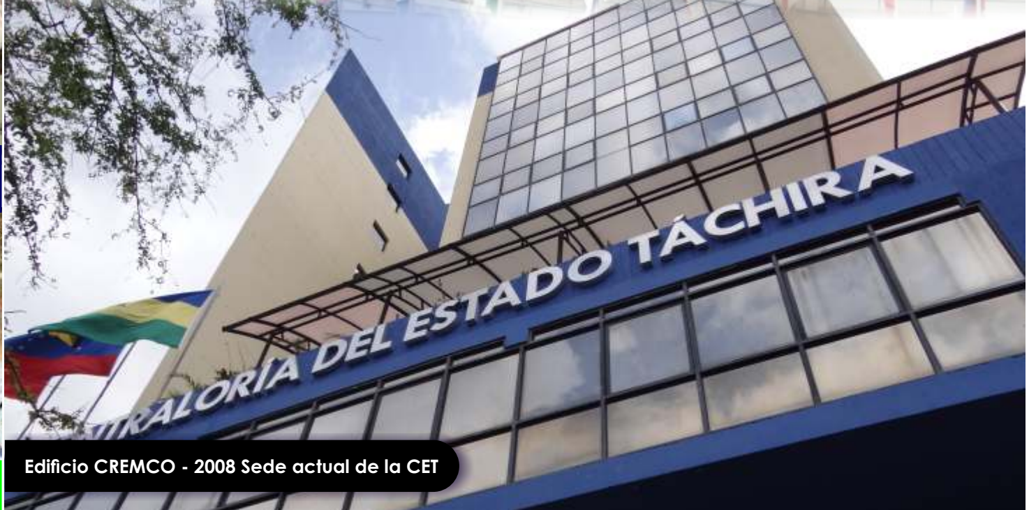
Edificio CREMCO - 2008 Sede actual de la CET