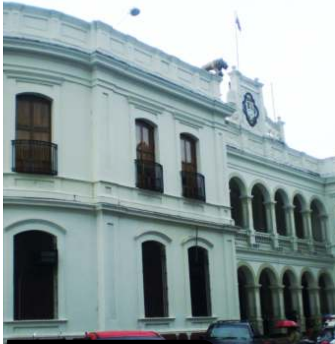
Palacio de los Leones en 1979