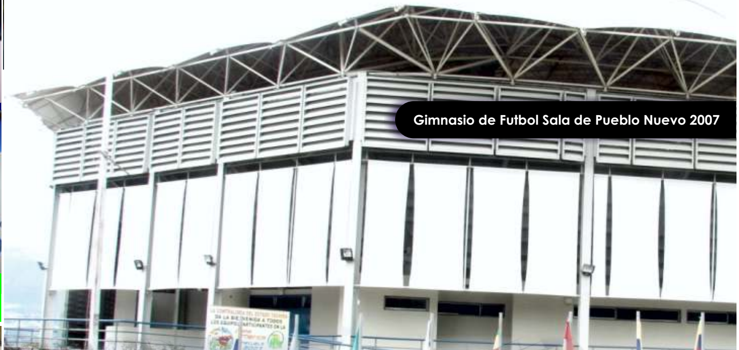
Gimnasio de Fútbol Sala de Pueblo Nuevo 2007