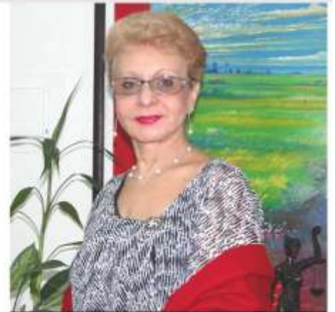
Dra. Omaira De León Contralora del Estado Táchira

En la CET nos esforzamos por ser un órgano reconocido por altos niveles de calidad en nuestros productos y servicios; generando una mejora en todos los procesos medulares y de apoyo que rigen a este Órgano de Control Fiscal.