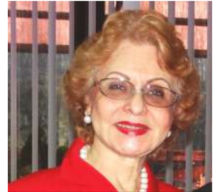
Dra. Omaira De León Contralora del Estado Táchira

Siempre buscamos la verdad para un sano y correcto manejo de los recursos públicos de la entidad tachirense. Estamos alertas para prevenir y sancionar al funcionario público que incurra en actos de corrupción dentro de la administración activa regional.