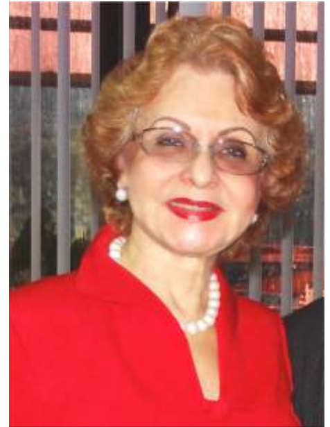
Dra. Omaira De León Contralora del Estado Táchira

Es por ello, que en este órgano de control fiscal estamos orientando y capacitando contantemente a las comunidades a fin de fortalecer un buen manejo de los recursos a través del control social que ejercen los ciudadanos de la región.