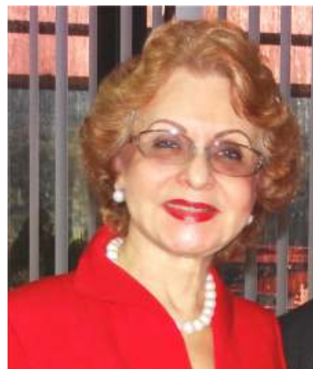
Dra. Omaira De León Contralora del Estado Táchira

De igual forma, continuamos con el fortalecimiento de valores en el nuevo ciudadano a través del programa institucional “La Contraloría Va a la Escuela”, con el fin de ir luchando desde la primera etapa contra el terrible flagelo de la corrupción.