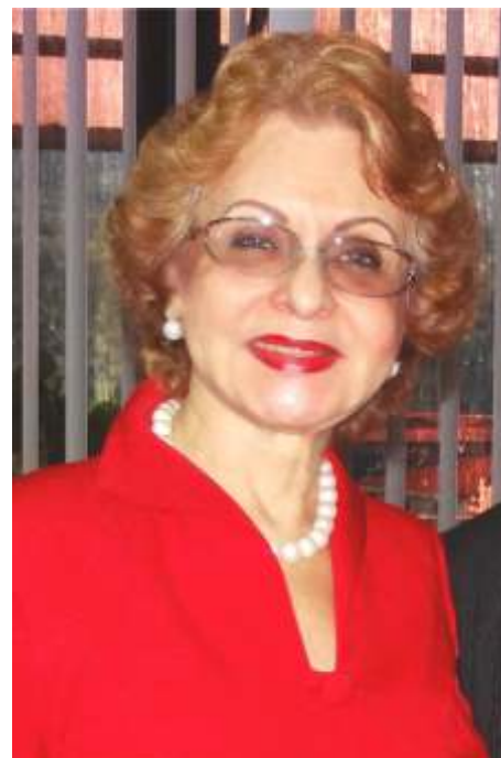
Dra. Omaira De León / Contralora del Estado Táchira

Con lo cual, esta Contraloría Estatal continua fomentando en los niños y niñas la cultura del control fiscal, a través de valores y promoviendo su participación activa en el quehacer diario escolar, estas acciones forman al ciudadano del mañana.