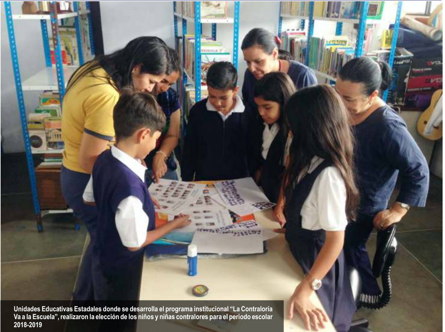
Unidades Educativas Estadales donde se desarrolla el programa institucional “La Contraloría Va a la Escuela”, realizaron la elección de los niños y niñas contralores para el periodo escolar 2018-2019

115 niños y niñas pertenecientes a 80 planteles educativos regionales fueron electos como contralores escolares. Esta actividad se desarrolla con el fin de consolidar en los elegidos, su legitimidad para actuar ante toda la colectividad como un contralor escolar, fortaleciendo su liderazgo natural y haciendo de la contraloría un quehacer diario en el ámbito educativo.