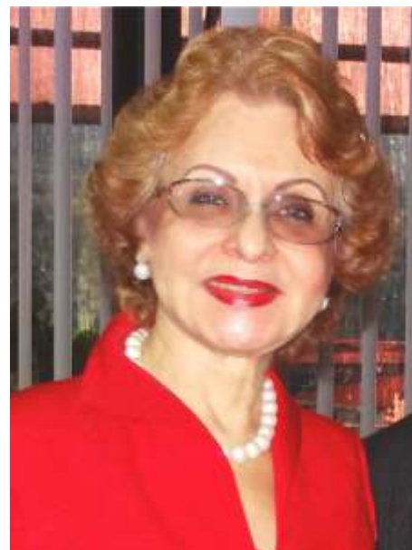
Dra. Omaira De León / Contralora del Estado Táchira

En esta Contraloría Estatal brindamos asesoría constante a la ciudadanía, a través de charlas y talleres, con el fin de mejorar la atención ciudadana, de igual forma estamos prestos en la recepción de denuncias, quejas, reclamos, sugerencias y/o peticiones, las cuales se tramitan de forma oportuna, eficiente y efectiva.