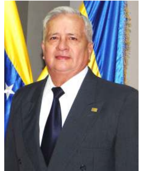
Dr. Pablo Reinaldo García Uzcátegui Contralor del Estado Táchira

Asimismo, dentro de las políticas internas fomentamos en los servidores públicos que forman parte de este Órgano Contralor principios y valores, con el fin de establecer un ambiente de armonía, donde se reflejen buenos resultados en el trabajo en equipo.