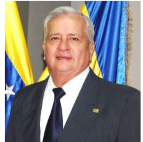
Dr. Pablo Reinaldo García Uzcátegui Contralor del Estado Táchira

En tal sentido, la Contraloría del Estado Táchira como integrante del Sistema Nacional de Control Fiscal y cumpliendo con lo establecido en la Constitución de la República Bolivariana de Venezuela, la Ley Orgánica de la Contraloría General de la República y del SNCF y el Plan Estratégico del SNCF 2019-2023, fomenta la participación ciudadana, en el ejercicio del control sobre la gestión pública, donde se persigue el uso eficiente y eficaz de los recursos públicos y donde además; se busca mejorar la calidad de vida de los habitantes del estado Táchira.