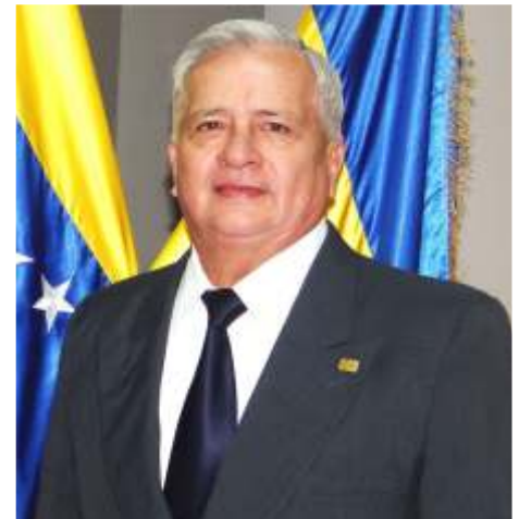
Dr. Pablo García Contralor del Estado Táchira

Para nosotros es fundamental brindar los mejores servicios y beneficios a nuestras servidoras y servidores públicos, ya que nuestro talento humano constituye la base para el logro de las actividades a corto, mediano y largo plazo, asegurando siempre un eficaz y efectivo cumplimiento de los objetivos.