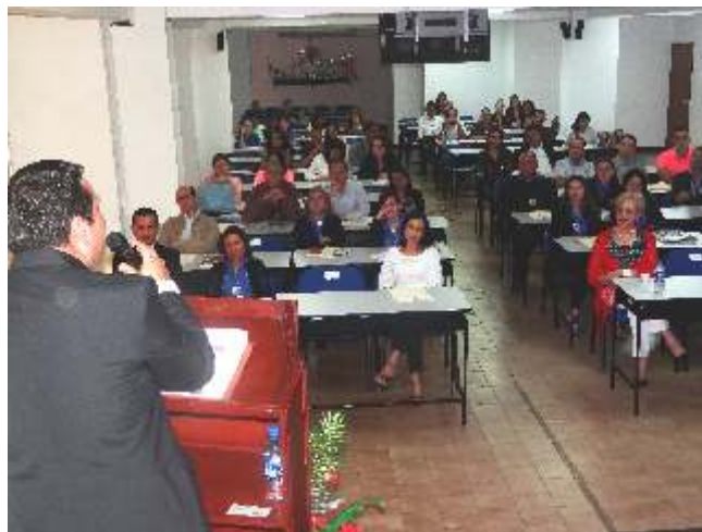
Con total éxito la Contraloría del Estado Táchira efectuó el V Encuentro Estatal de Órganos de Control Fiscal, actividad enmarcada en el Quincuagésimo Quinto Aniversario de esta Contraloría Estatal.