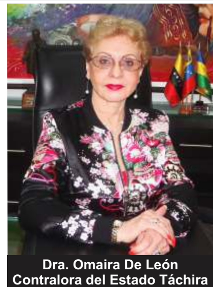
Dra. Omaira De León Contralora del Estado Táchira

Asimismo, se realizó el taller "Control de Obras" en las Contralorías municipales de Torbes, Antonio Rómulo Costa y Lobatera, donde se brindó información técnico-legal, para la ejecución de Obras Civiles, brindando una capacitación oportuna a la ciudadanía en materia de control fiscal y control social.