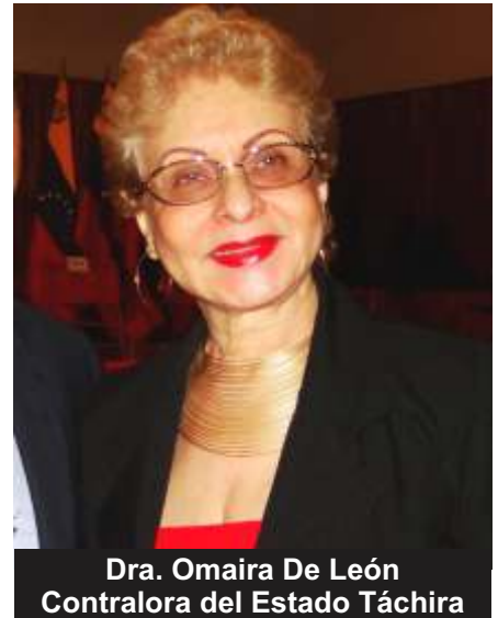
Dra. Omaira De León Contralora del Estado Táchira

De igual forma, continuamos con el fortalecimiento de valores en el nuevo ciudadano a través del programa institucional "La Contraloría Va a la Escuela", con el fin de ir luchando desde la primera etapa contra el terrible flagelo de la corrupción.