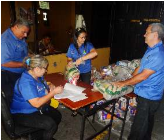
Funcionarios de la CET participando en la venta de estos productos

Este viernes 03 de marzo de 2017, la Contraloría del estado Táchira, con el apoyo de Comercializadora de Bienes y Servicios del Estado Táchira (Cobiserta), realizó un operativo de venta de productos de alimentación e higiene.