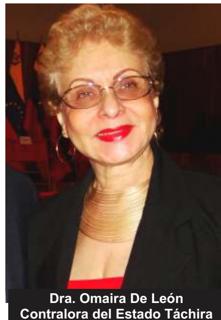
Dra. Omaira De León Contralora del Estado Táchira

Asimismo, buscamos promover la transparencia en los órganos y entidades sujetos a control en el Estado, con el propósito de disminuir sustancialmente los índices de corrupción e impunidad y mejorar la calidad de vida de los habitantes del Estado Táchira.