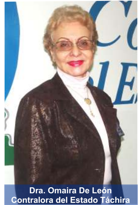
Dra. Omaira De León Contralora del Estado Táchira

Capacitando a las comunidades es la única forma de transformar a los ciudadanos y prevenir los hechos de corrupción.