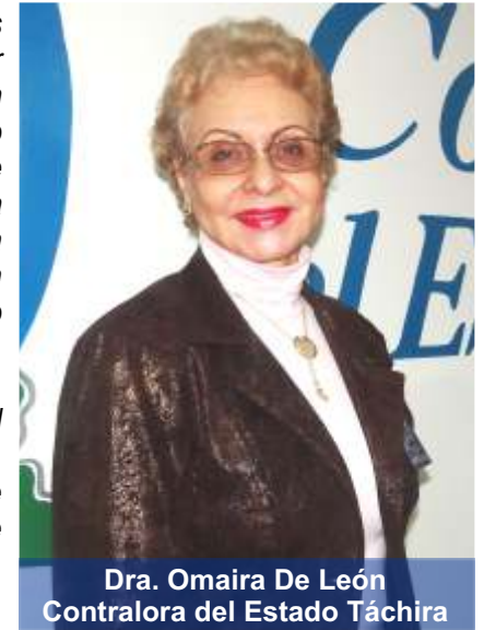
Dra. Omaira De León Contralora del Estado Táchira

Con la participación ciudadana se fortifica el Poder Popular, ya que se ejercen los derechos, se democratiza la toma de decisiones y se aportan soluciones a los problemas que se presentan en las comunidades.