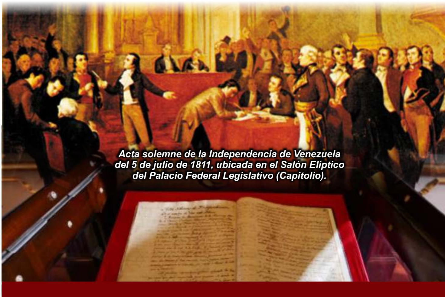
Acta solemne de la Independencia de Venezuela del 5 de julio de 1811, ubicada en el Salón Elíptico del Palacio Federal Legislativo (Capitolio).

Venezuela fue el primer país de Iberoamérica que declaró su independencia, con lo cual se acrecentó la tendencia independentista en la región. Simón Bolívar, el Libertador, además de ser protagonista central de estos eventos en nuestro país, contribuyó también de manera histórica y decisiva a lograr la independencia de las actuales Bolivia, Colombia, Ecuador y Perú.