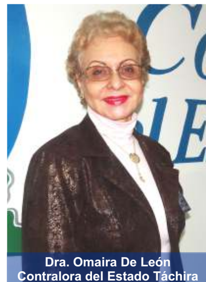
Dra. Omaira De León Contralora del Estado Táchira

“Hay una tarea insoslayable y permanente que debemos cumplir todos los órganos de control fiscal, luchar contra la corrupción tarea dura, exigente, difícil y compleja, pues es luchar el hombre y su formación, contra un mundo que tiene una nula o escasa formación ciudadana, que no es otra cosa que una escasa formación de valores”.