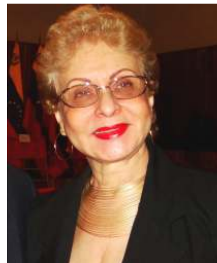
Dra. Omaira De León Contralora del Estado Táchira

De tal manera, este Órgano de Control Fiscal en su lucha incesante contra el flagelo de la corrupción en la administración pública, garantiza que la ciudadanía vea satisfechas sus demandas a través de una gestión transparente en los Entes que administran los recursos del Estado y que tienen la obligación de atender de manera oportuna a través de sus diversos campos de acción las necesidades de la sociedad.