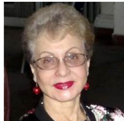
Dra. Omaira De León Contralora del Estado Táchira

De esta manera, la Contraloría del Estado Táchira promueve el mejoramiento continuo y la modernización de cada proceso desarrollado dentro de este Órgano de Control Fiscal, y de esta manera fortalecer las actuaciones y acciones fiscales orientadas al control, vigilancia y fiscalización del buen manejo del Patrimonio Público del Estado.