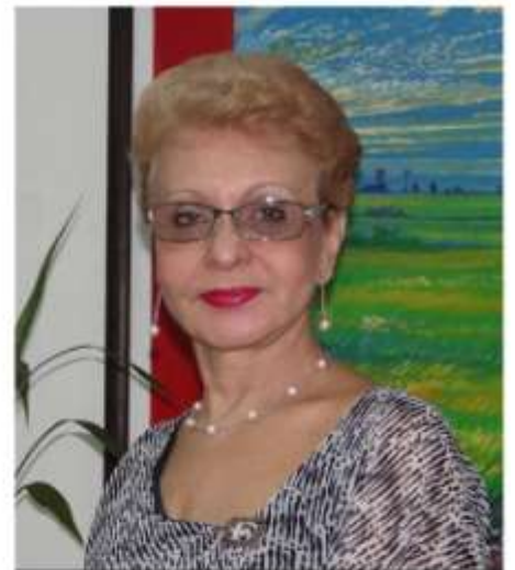
Dra. Omaira De León Osorio Contralora del Estado Táchira

Nosotros como entes de control, consideramos que la participación de la ciudadanía en el ejercicio del control social nos permite fortalecer la transparencia pública en cada gestión y demostrar que se cumple la Ley y las normas legales en conformidad con lo previsto por la Constitución de la República Bolivariana de Venezuela.