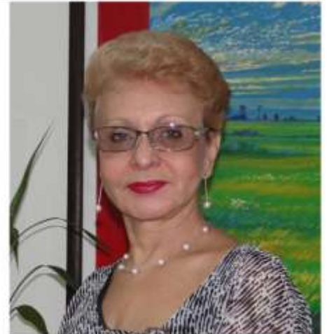
Dra. Omaira De León Osorio Contralora del Estado Táchira

Asimismo, somos un Órgano de Control Fiscal que continúa ejecutando una serie de actividades que vinculan a los tachirenses en el ejercicio del control social como complemento del control fiscal; actividades y eventos desarrollados en las diferentes localidades del Estado, ya que se quiere instruir a la comunidad sobre la importancia de participar en la vigilancia de la gestión pública; actividades que reafirma el compromiso de este órgano contralor con el Poder Ciudadano.