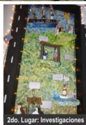
2do. Lugar: Investigaciones