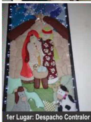
1er Lugar: Despacho Contralor