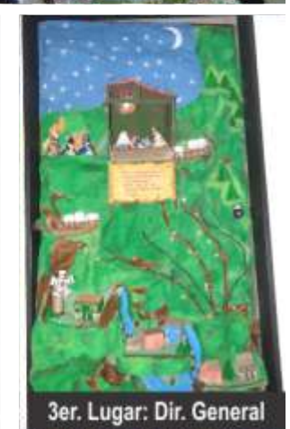
3er. Lugar: Dir. General