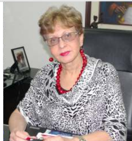
Dra. Omaira De León Contralora del Estado Táchira

Como Contraloría Estatal, diariamente nos esforzamos por ser un órgano reconocido por los altos niveles de calidad de nuestros productos y servicios; así generamos una mejora continua en todos los procesos medulares y de apoyo que rigen a este Órgano de Control Fiscal.