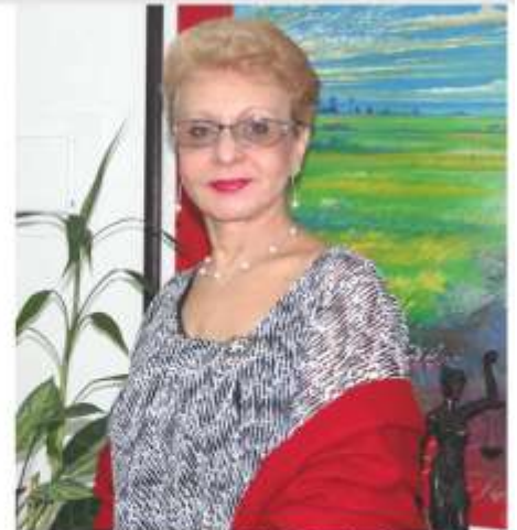
Dra. Omaira De León Contralora del Estado Táchira

De igual forma, esta Contraloría Estatal enfoca sus esfuerzos en materia de gestión del talento humano con el fin de desarrollar y fortalecer las competencias y capacidades de los Servidores Públicos que son integrantes de este órgano contralor, muestra de ello, es el inicio de la V Cohorte de la Escuela Gubernamental de Auditoría de Estado.