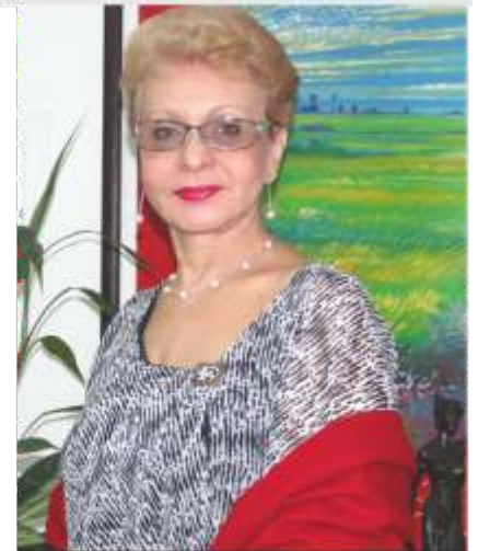
Dra. Omaira De León Contralora del Estado Táchira

De igual forma, continuamos con el mantenimiento eficaz y eficiente de nuestras instalaciones, con el fin de brindar los mejores servicios a nuestros servidores y servidoras públicos.