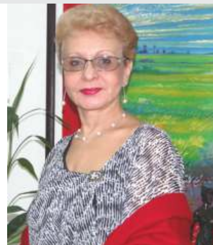
Dra. Omaira De León Contralora del Estado Táchira

De igual forma, a lo largo de nuestra gestión nos hemos esmerado por brindar los mejores servicios a nuestros servidoras y servidores públicos, con el fin de velar por los beneficios de todos los hombres y mujeres que trabajan día a día en pro del buen manejo de los recursos públicos del Estado.