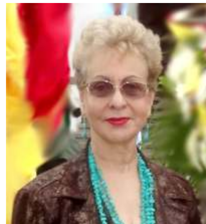
Dra. Omaira De León Contralora del Estado Táchira

De igual forma, a través de la Oficina de Atención al Público y Participación Ciudadana forma y capacita a las Abuelas y los Abuelos en materia de Control, concientizándolos sobre sus deberes y derechos, que le permitan a través de la recreación mejorar la calidad de vida; así como también, le permitan ejercer las funciones de control, supervisión y vigilancia de los recursos que le son asignados por el Estado a las Instituciones de las cuales son beneficiarios.