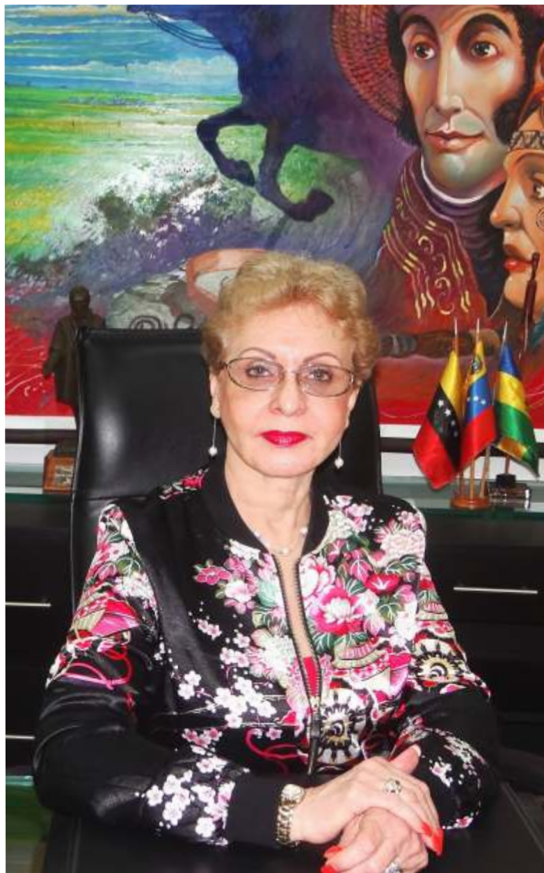
Dra. Omaira De León Contralora del Estado Táchira

La Contraloría General de la República ha dictado en el presente año dos instrumentos normativos, el primero las Normas Generales de Control Interno enfocadas en el logro de la eficacia de la gestión pública y fortalecer el control del estado, con el propósito que los órganos y entes de la Administración Pública establezcan y mantengan adecuados controles internos, de forma tal que el control fiscal externo se complemente con el que corresponde ejercer a la administración activa. Y el segundo instrumento, es el primer Plan Estratégico del Sistema Nacional de Control Fiscal; cuyo norte es la lucha contra la corrupción y la impunidad, para beneficio del ciudadano y ciudadana como centro y objeto del sistema, direccionado como lo indica su visión: al "ejercicio coordinado del control de los recursos públicos, con un alto componente ético, profesional, tecnológico, de participación ciudadana y rendición de cuenta, cuyos integrantes gocen de la confianza, credibilidad y apoyo de la comunidad, para coadyuvar con el estado en el logro de la mayor suma de felicidad social...".