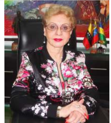
Dra. Omaira De León Contralora del Estado Táchira

Asimismo, cómo Órgano Contralor tenemos el propósito de ejercer un control gubernamental de alta calidad, dirigido a promover la transparencia y manejo racional de los recursos públicos, la participación activa de la ciudadanía y contribuir a la disminución de la corrupción e impunidad, todo en el marco de la normativa legal vigente. Procesos que se pueden cumplir gracias al apoyo de todo nuestro equipo humano competente, responsable y comprometido con el mejoramiento continuo de los procesos.