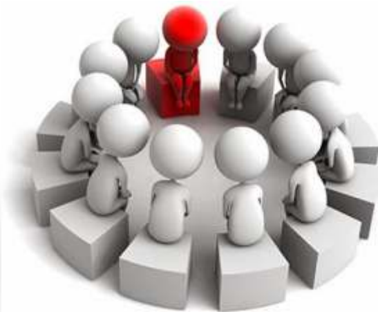
Requisito indispensable de una persona comprometida: Alto grado de integración, disposición física y disposición emocional e intelectual