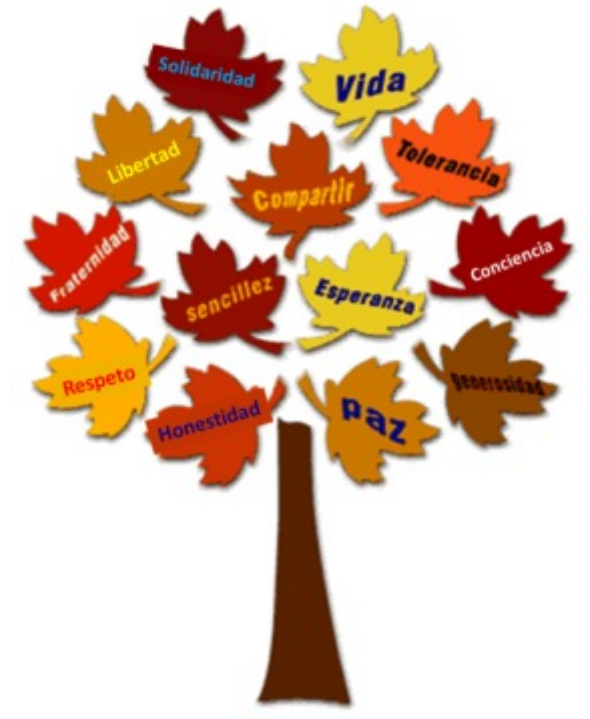
LA BASE DE LOS VALORES MORALES HUMANOS