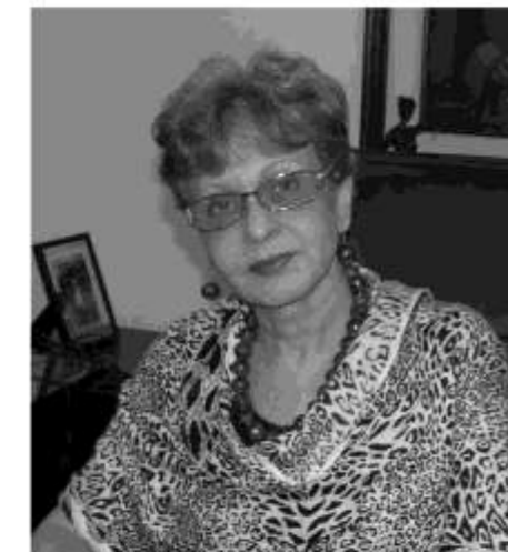
Dra. Omaira De León Osorio Contralora del Estado Táchira

Es de recordar que la CET, ha sido pionera en ese acercamiento e implementación de la cultura anticorrupción, con los diferentes programas de orientación y capacitación en control fiscal, en el que destaca el programa "La Contraloría Va a la Escuela", que tuvo su nacimiento en el Táchira y que actualmente ha sido implementado por las Contralorías Estadales a nivel nacional; programa que viene a fortalecer los valores y principios contralores, formando en las diferentes Unidades Educativas Estadales, al funcionario del mañana.