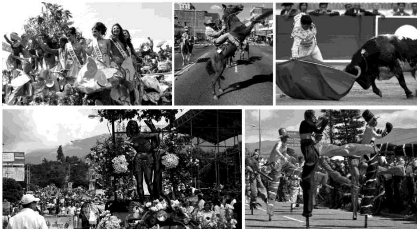
Una Producción Más de la División de Imagen Corporativa y Eventos Especiales de la Contraloría del Estado Táchira

Actualmente esta celebración es un icono representativo de Venezuela a nivel internacional, no sólo por sus espectáculos únicos sino también por su elegancia y gran organización.