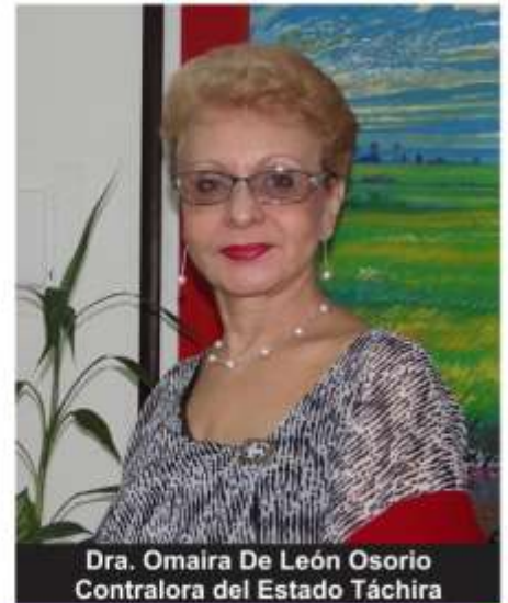
Dra. Omaira De León Osorio Contralora del Estado Táchira

Así pues, La Contraloría del Estado Táchira en el ejercicio de sus funciones verifica la legalidad, exactitud, eficiencia en todos y cada uno de los procesos que realiza la administración pública, para así inspeccionar y fiscalizar con eficiencia cada uno de los métodos implementados, y ser garante del cumplimiento de la Norma.