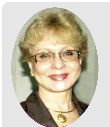
Dra. Omaira De León Osorio Contralora del Estado Táchira

Siempre garantizamos que la ciudadanía vea satisfechas sus demandas a través de una gestión transparente en los órganos y entes que administran los recursos del Estado y que tienen la obligación de atender de manera oportuna a través de sus diversos campos de acción las necesidades de la sociedad.