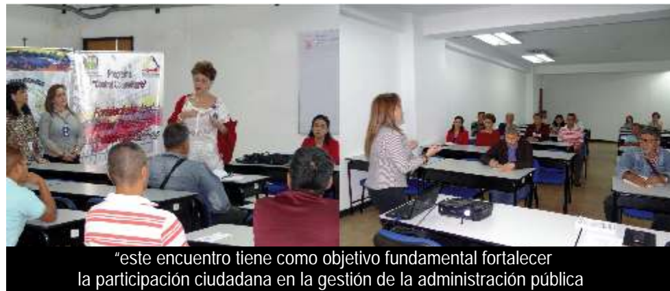
“este encuentro tiene como objetivo fundamental fortalecer la participación ciudadana en la gestión de la administración pública”