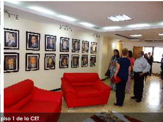
Inauguración de la Biblioteca "Dr. Manuel Galindo Ballesteros" en el piso 1 de la CET