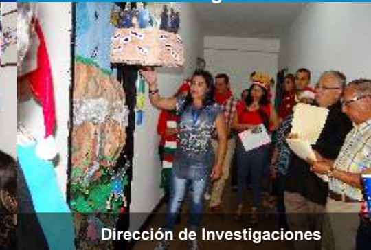
Dirección de Investigaciones