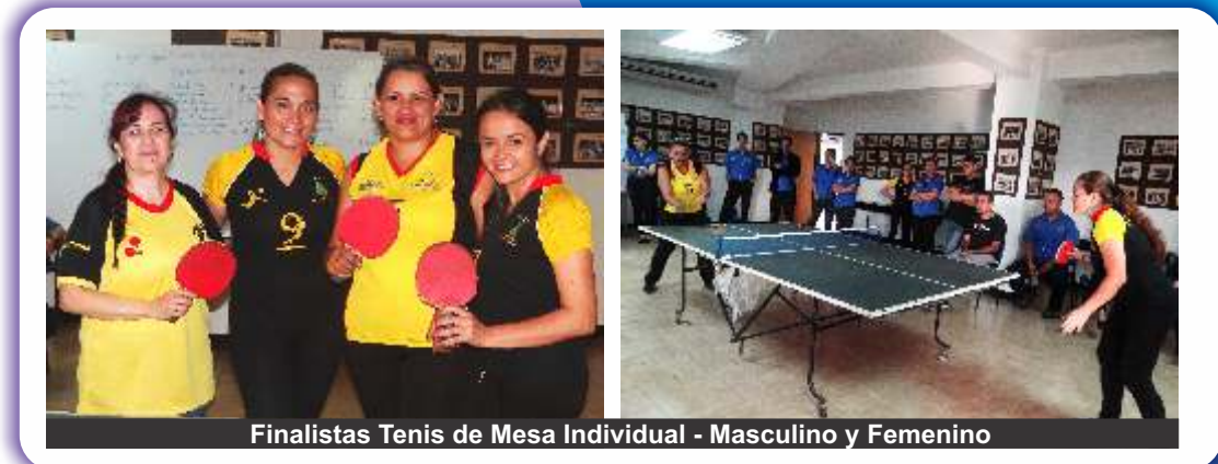
Finalistas Tenis de Mesa Individual - Masculino y Femenino