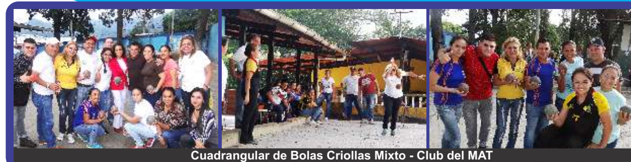
Cuadrangular de Bolas Criollas Mixto - Club del MAT