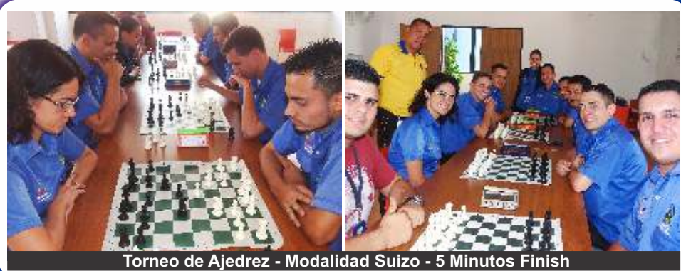
Torneo de Ajedrez - Modalidad Suizo - 5 Minutos Finish

Es oportuno recordar que gracias a la continuidad y apoyo de las autoridades a este tipo de eventos, los funcionarios deportistas han elevado su nivel competitivo al punto que la Contraloría del Estado Táchira, es potencia deportiva a escala nacional.