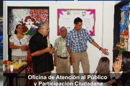
Oficina de Atención al Público y Participación Ciudadana