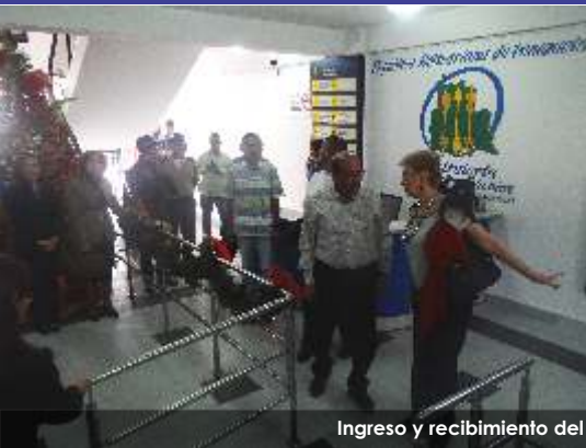
Ingreso y recibimiento del Contralor General de la República en las Instalaciones de la Contraloría del Estado Táchira