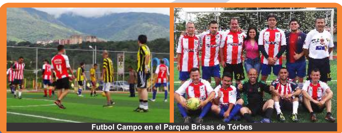
Fútbol Campo en el Parque Brisas de Tórbes