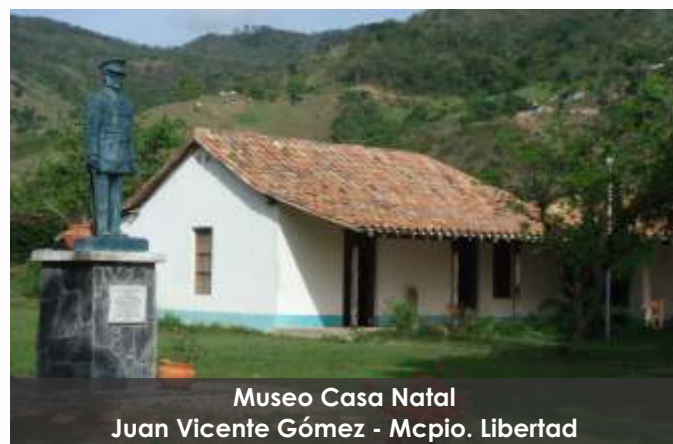
Museo Casa Natal Juan Vicente Gómez - Mcpio. Libertad