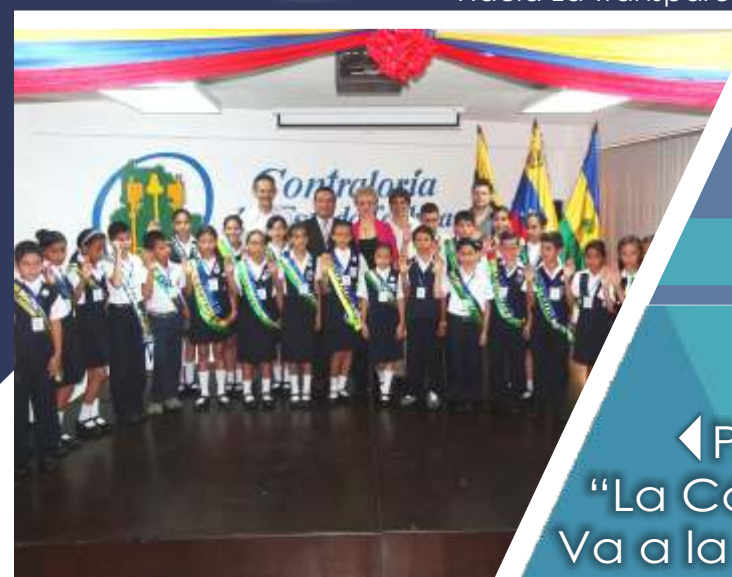
Programa "La Contraloría Va a la Escuela"