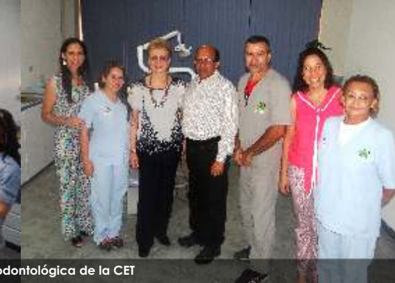
Personal Médico realiza Pruebas de tensión durante la visita al área médico-odontológica de la CET