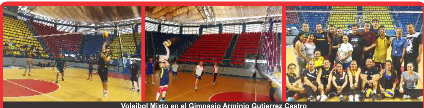
Voleibol Mixto en el Gimnasio Arminio Gutierrez Castro