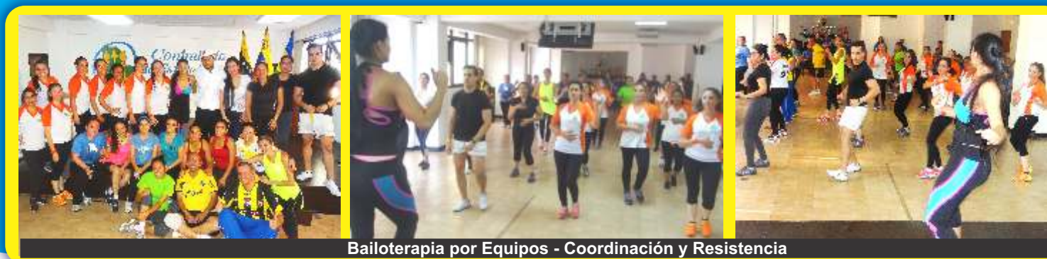
Bailoterapia por Equipos - Coordinación y Resistencia