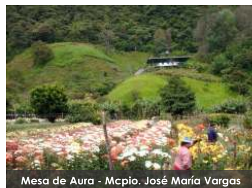
Mesa de Aura - Mcpio. José María Vargas