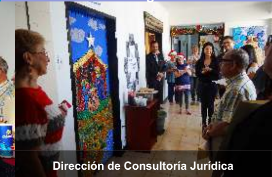
Dirección de Consultoría Jurídica