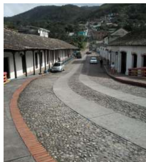
Los Corredores - Mcpio. Junin