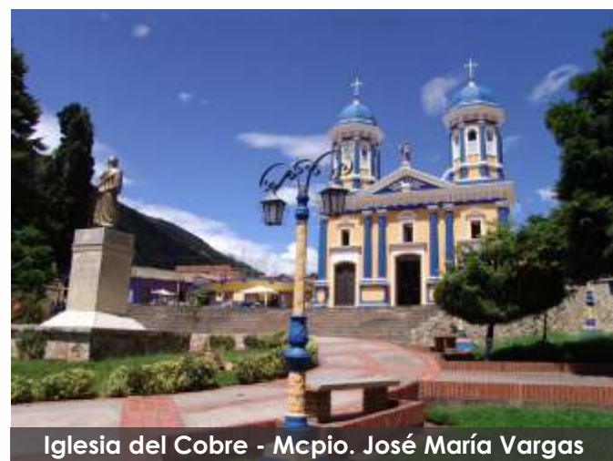
Iglesia del Cobre - Mcpio. José María Vargas