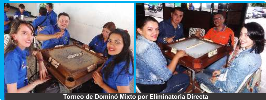
Torneo de Dominó Mixto por Eliminatoria Directa